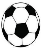
FC Eintracht Norderstedt